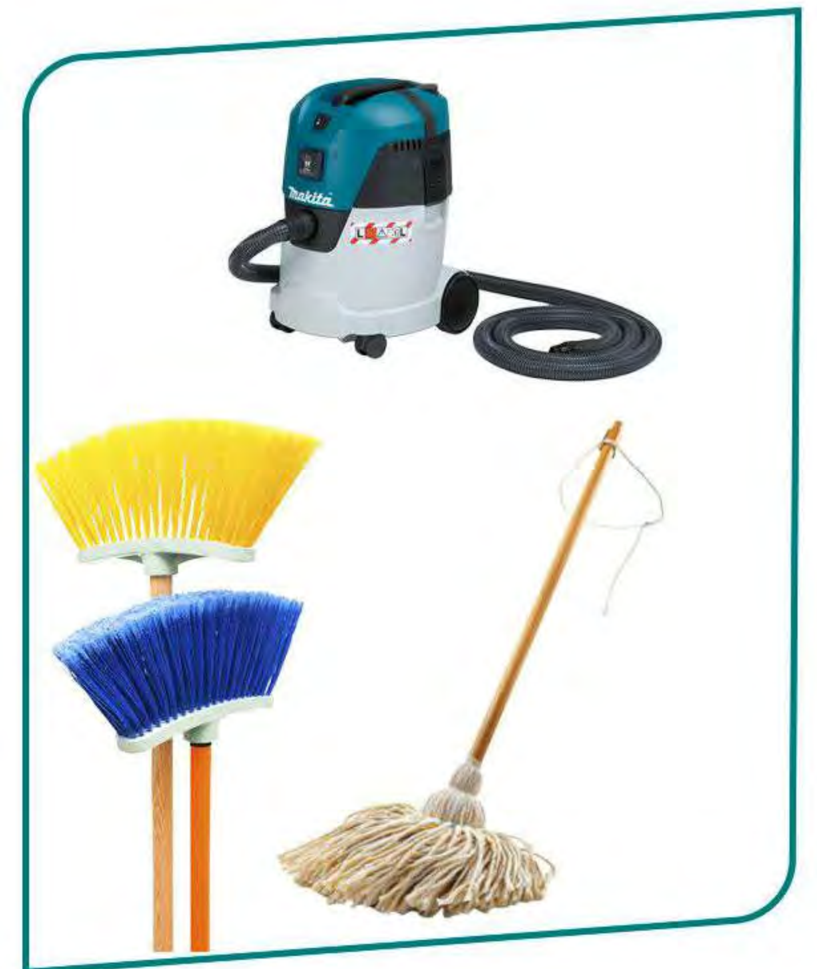
Accesorios de Limpieza