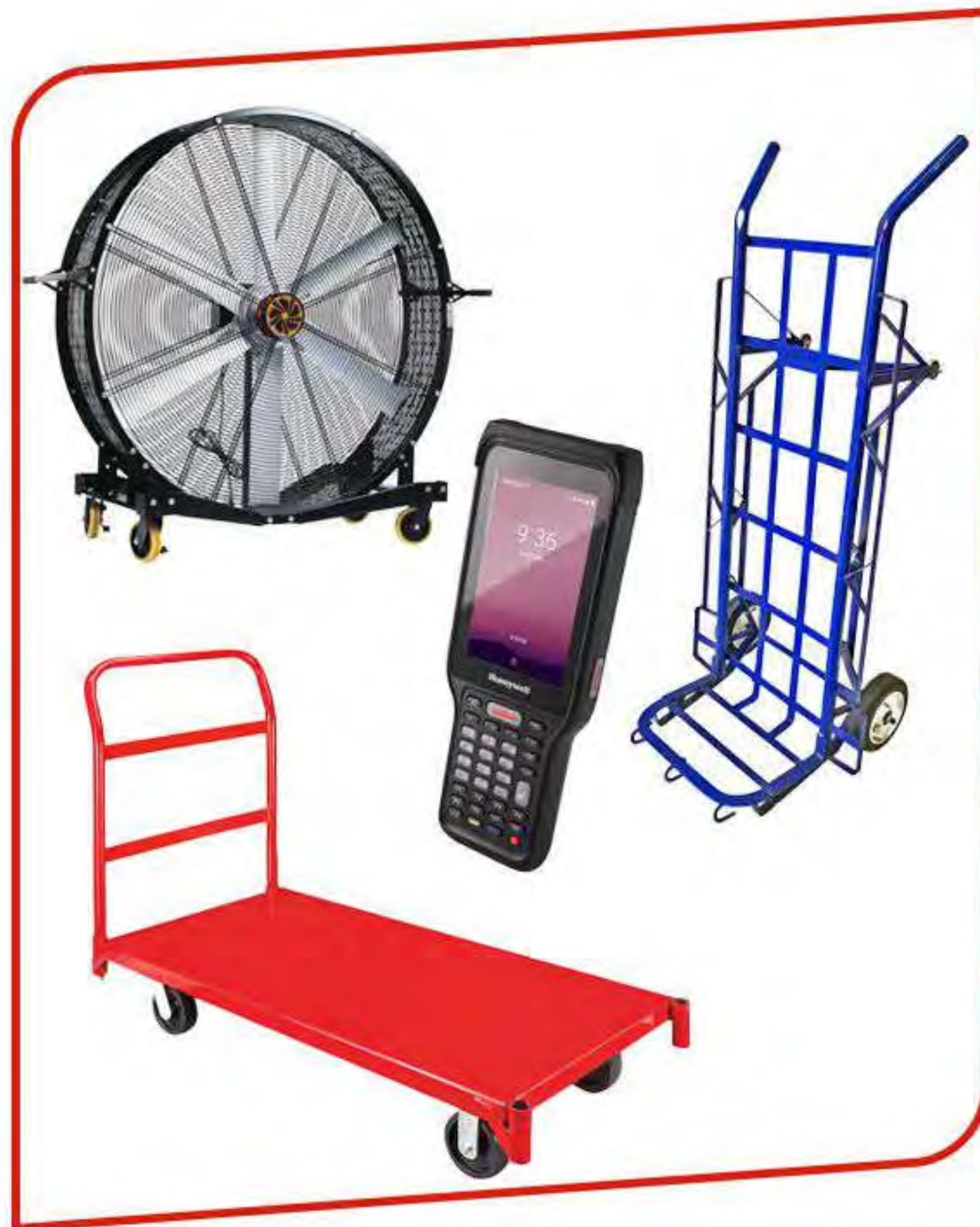
Equipo de almacen