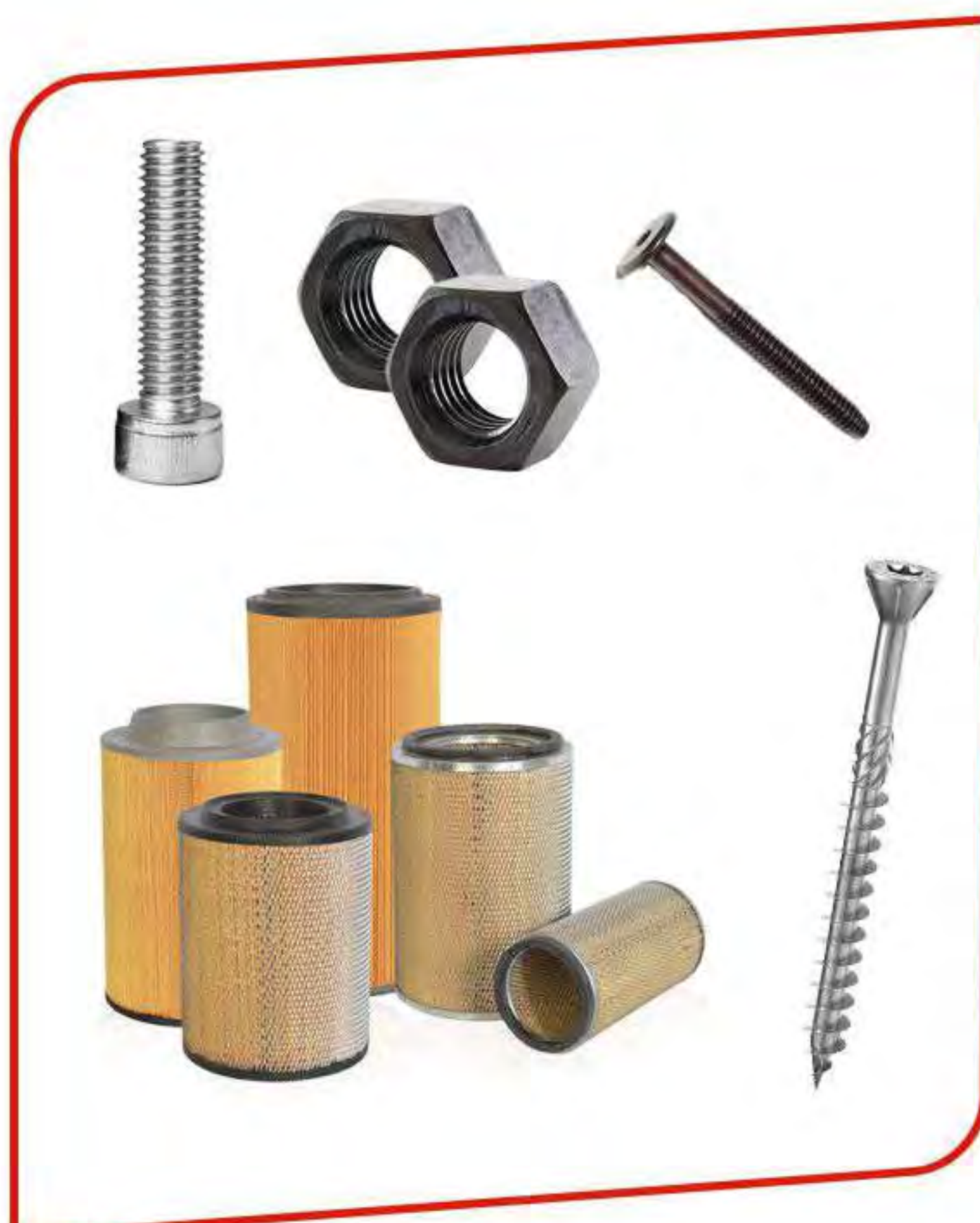
Numeros de Parte y MRO