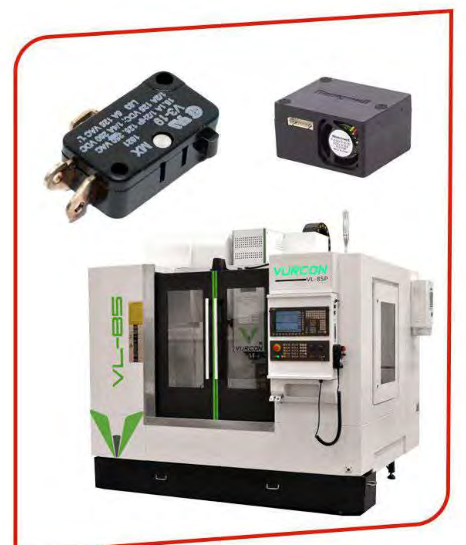
Maquinaria y componentes