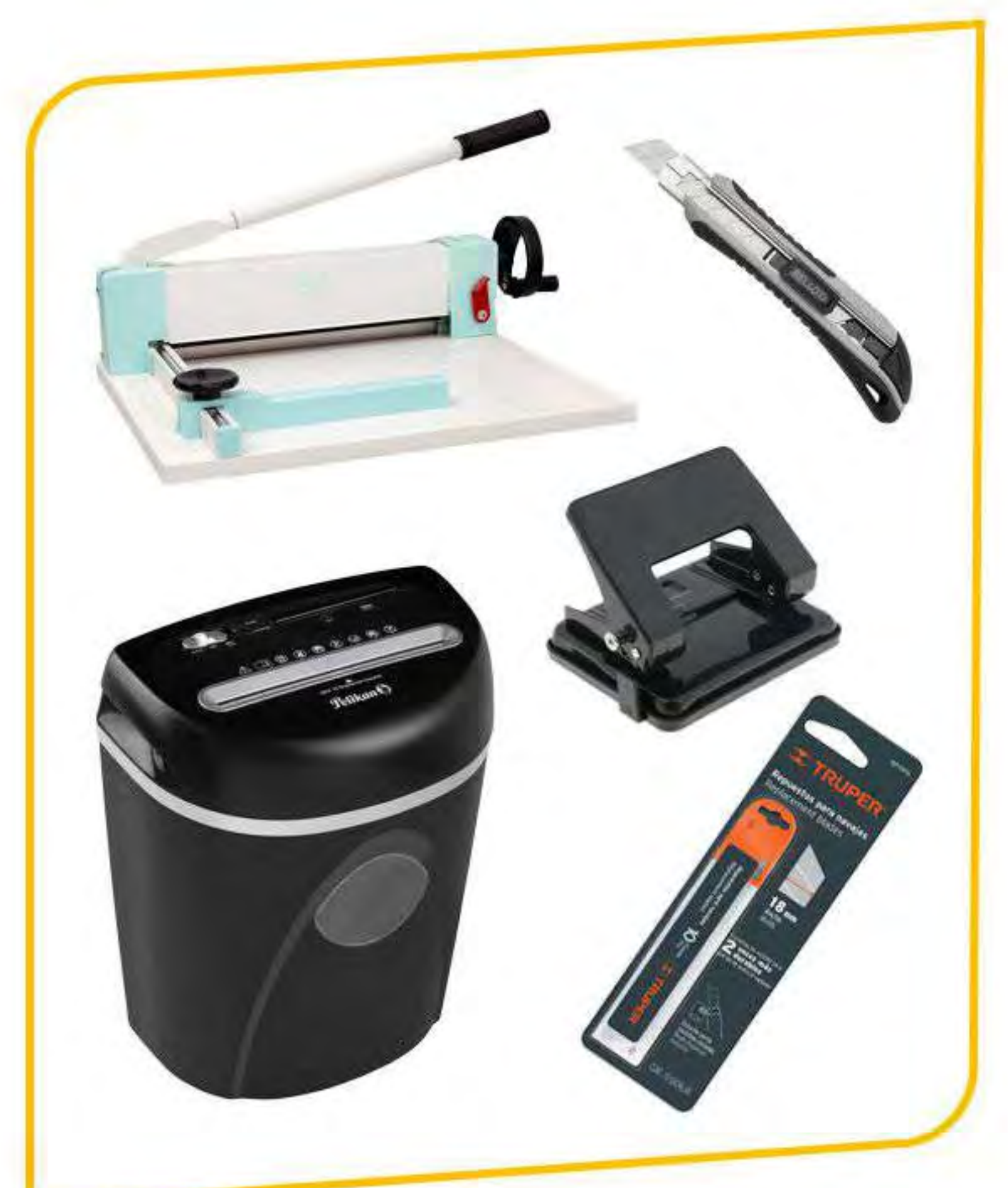
Articulos para cortar