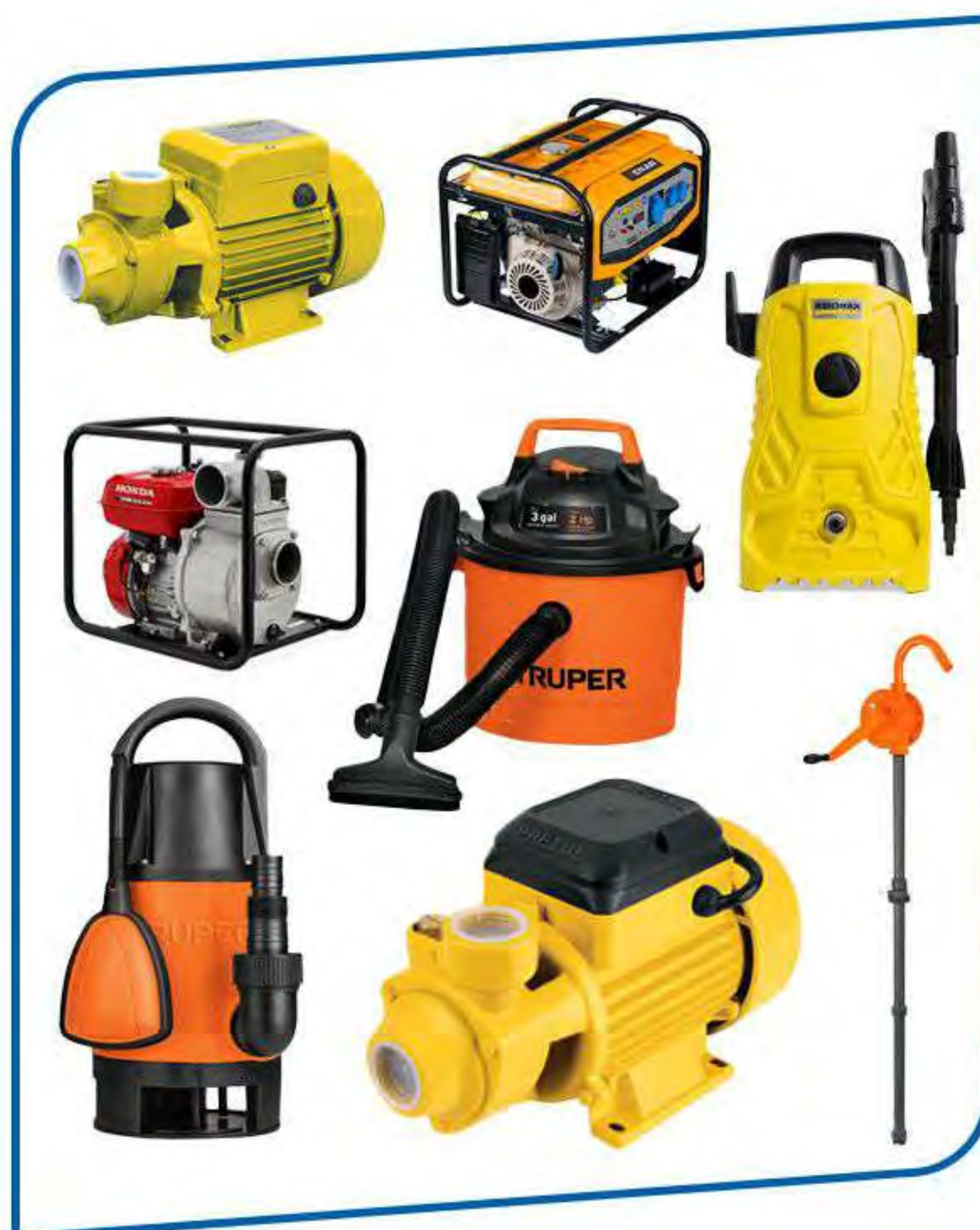
Motores y generadores