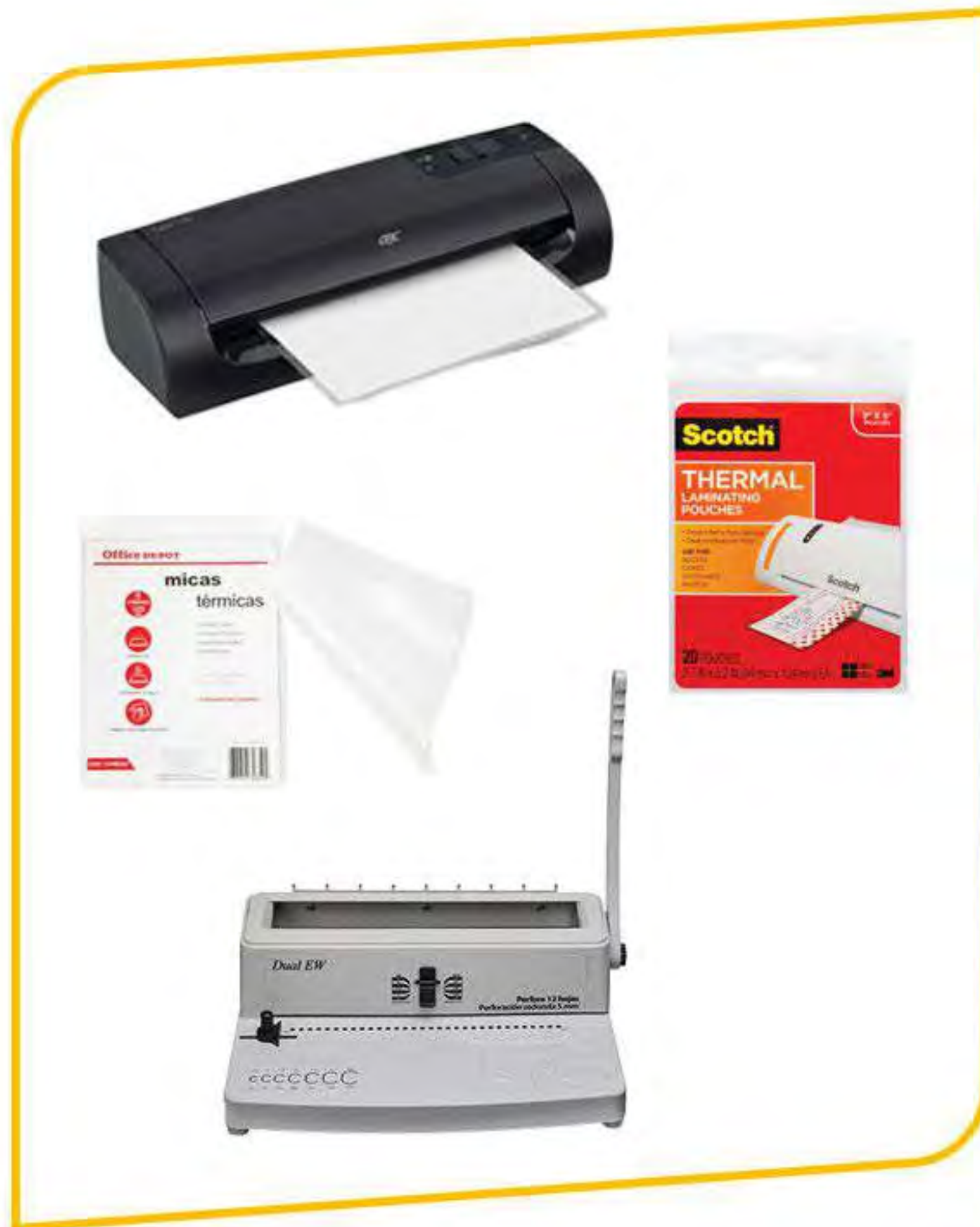
Enmicadoras y Engargoladoras