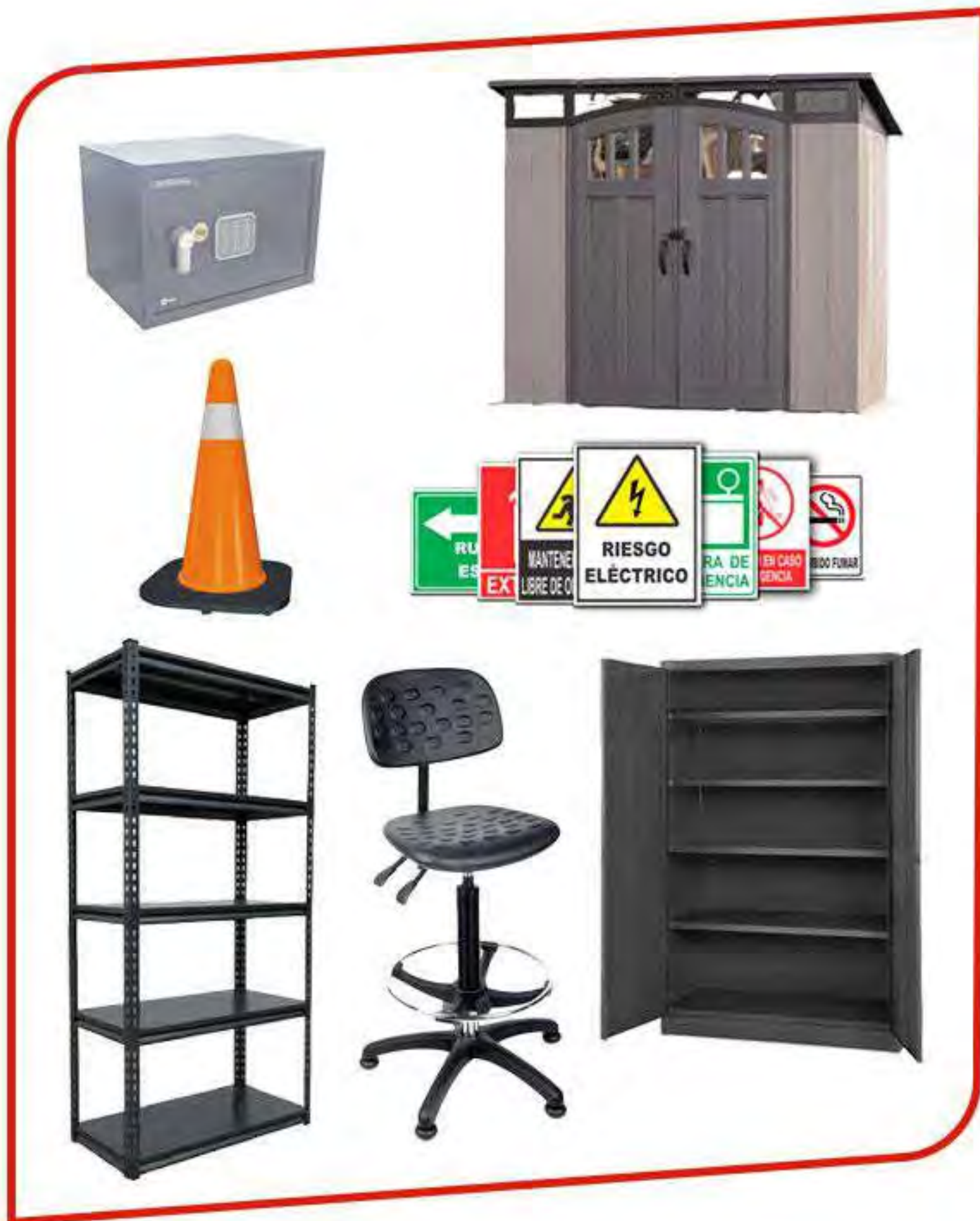
Mobiliario y señalamiento