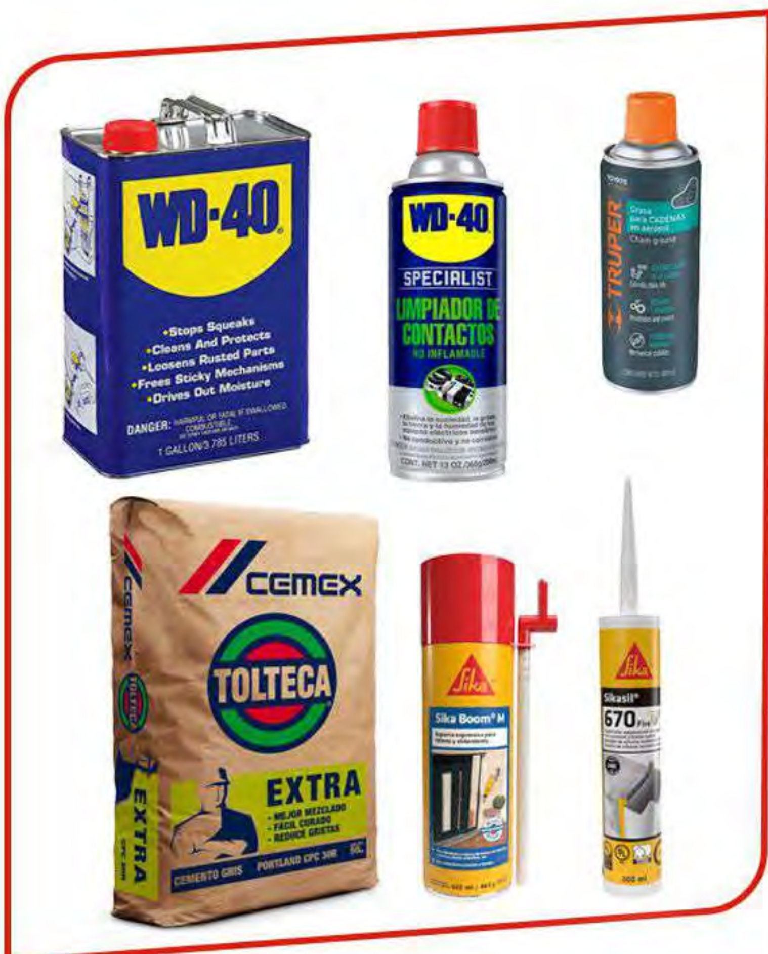
Lubricantes, Quimicos y Adhesivos