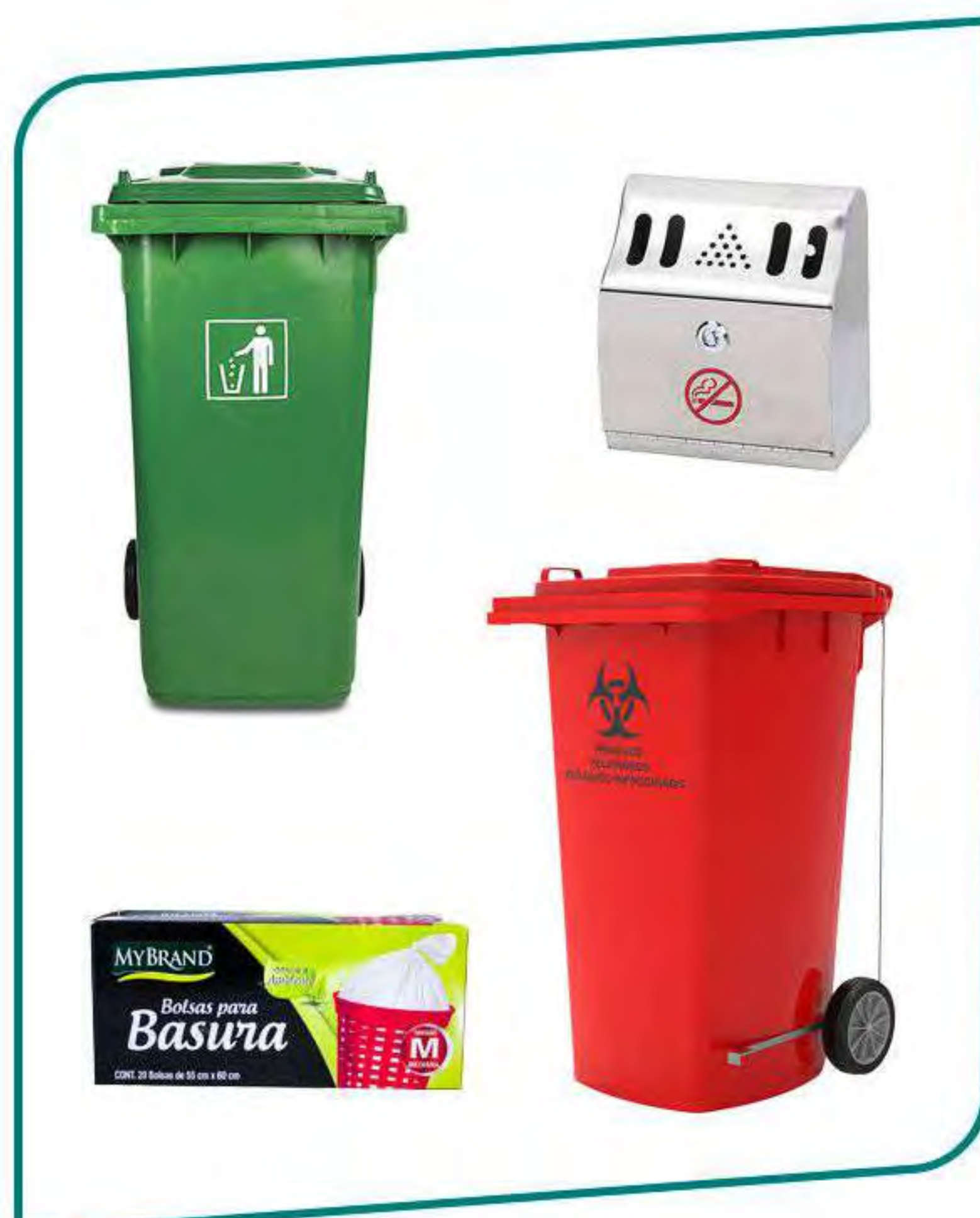
Contenedores y Despachadores