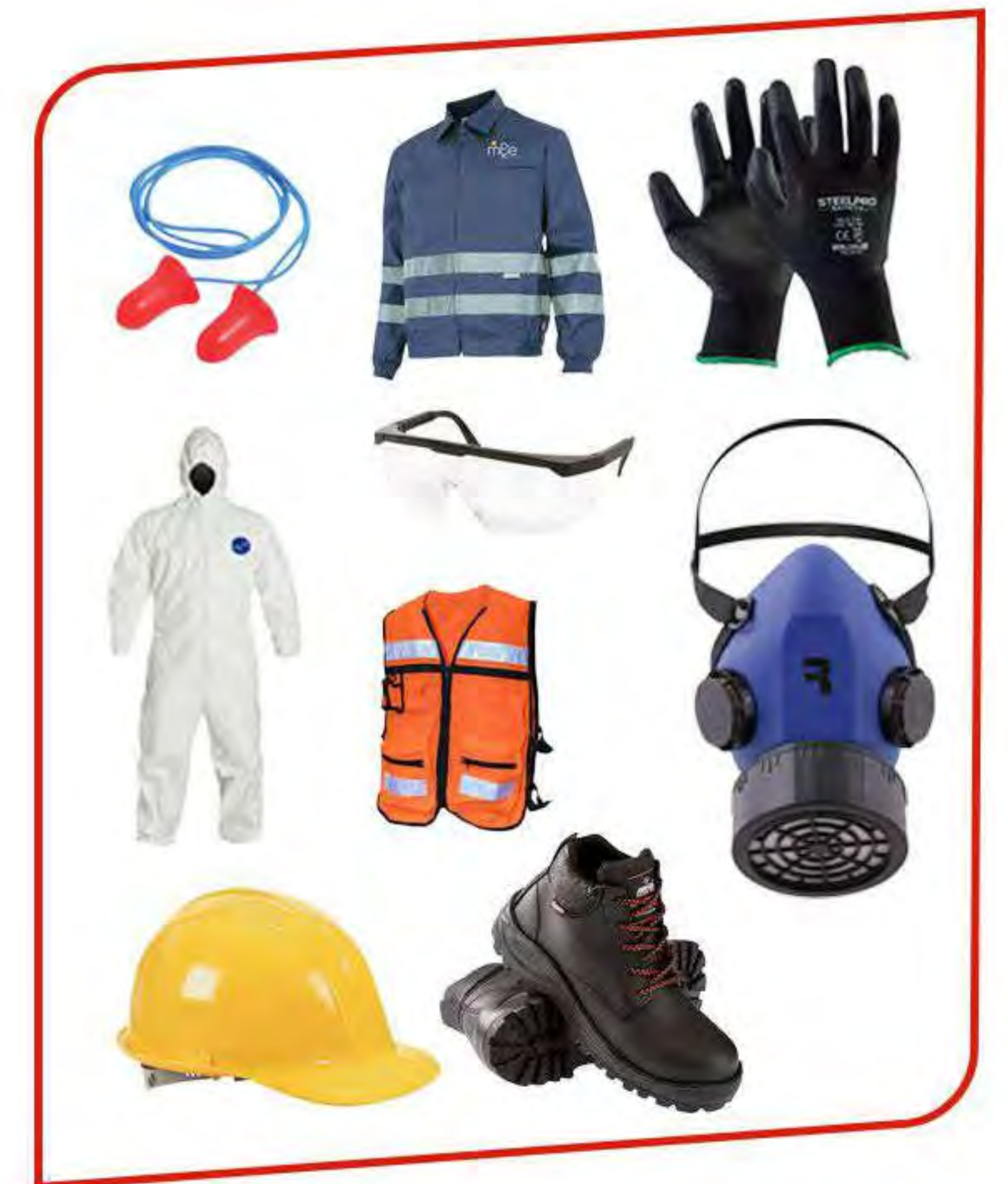
Proteccion personal y uniformes